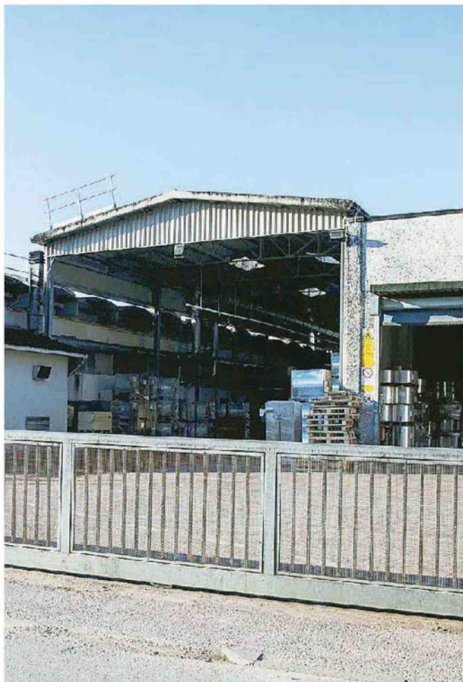
I capannoni della Fm Plastic in via del Lavoro a Lamporecchio